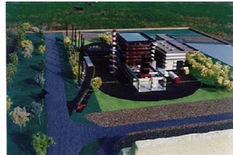
Four d'incinération des boues de sortie de Station d'épuration de Lacq ( 64 ) Ech : 200 ième