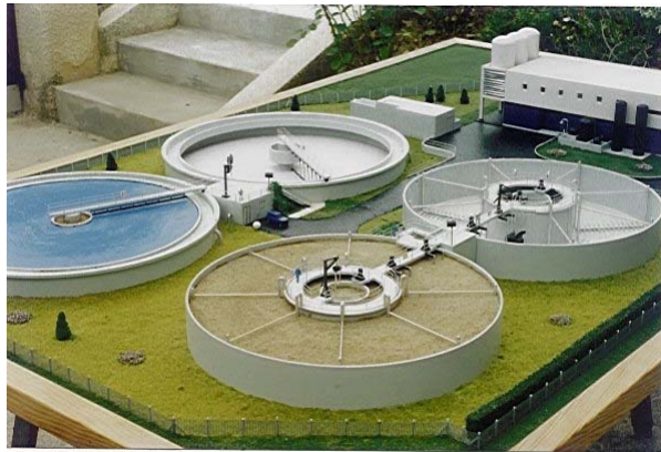
Bassins biologiques et clarificateurs