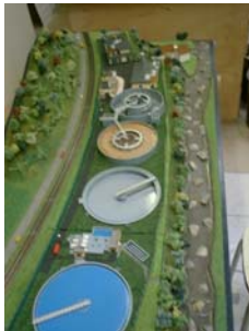
Station d'épuration de Lourdes ( 65 ) Ech : 200 ième