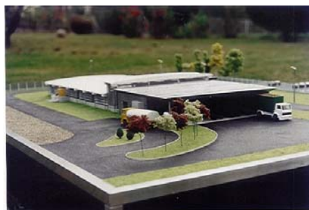
Station d'épuration de L'usine l'Oreal de Rambouillet ( 78 ) Ech : 87 ième