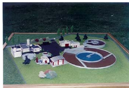
Station d'épuration d'Aurillac ( 15 ) Ech : 200 ième