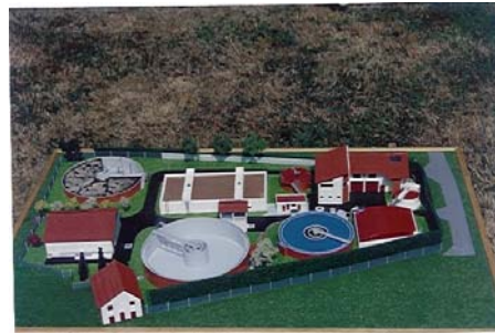
Station d'épuration de Bidart ( 64 ) Ech : 100 ième