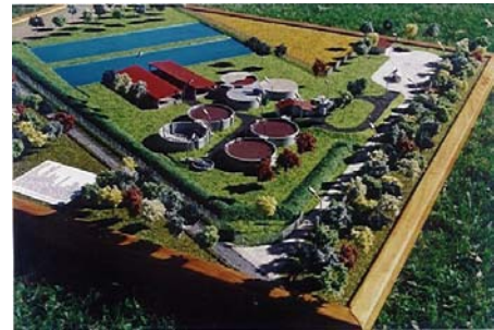
Station d'épuration de Saint Emilion ( 33 ) Ech : 200ième