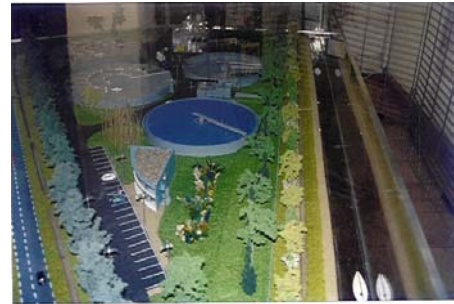
Station d'épuration de Narbonne ( 11 ) Ech : 100 ième, électrifiée