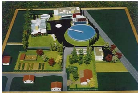
Station d'épuration de St Frédéric à Bayonne ( 64 ) Ech : 100 iémé