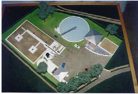
Station d'épuration de Villeneuve Les Maguelone ( 34 ) Ech : 100 ième