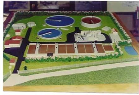
Station d'épuration de La Courarde, Ile de Ré Ech : 200 ième