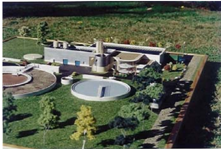
Station d'épuration de Ploemeur ( 56 ) Ech : 100 ième