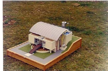
Usine d'eau potable Nord Est de Pau ( 64 ) Ech : 30 ième