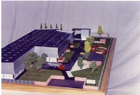
Centre de compostage et de transfert des déchets alimentaires de Bapaume ( 62 ) Ech : 100 ième