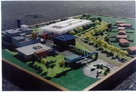
Station d'épuration Pont de l'Aveugle à Bayonne ( 64 ) Ech : 200 ième