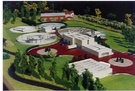
Station d'épuration de Montauban ( 82 ) Ech ; 220 ième