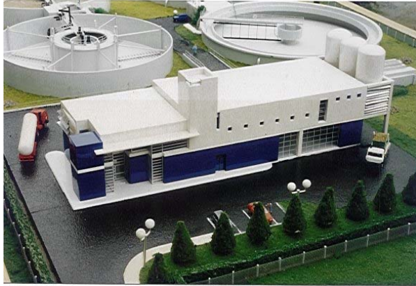
Station d'épuration d'AUCH ( 32 ) Ech : 87 ième