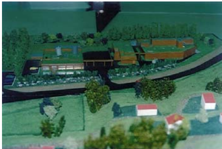
Station d'épuration de Biarritz ( 64 ) Echl : 200 ième